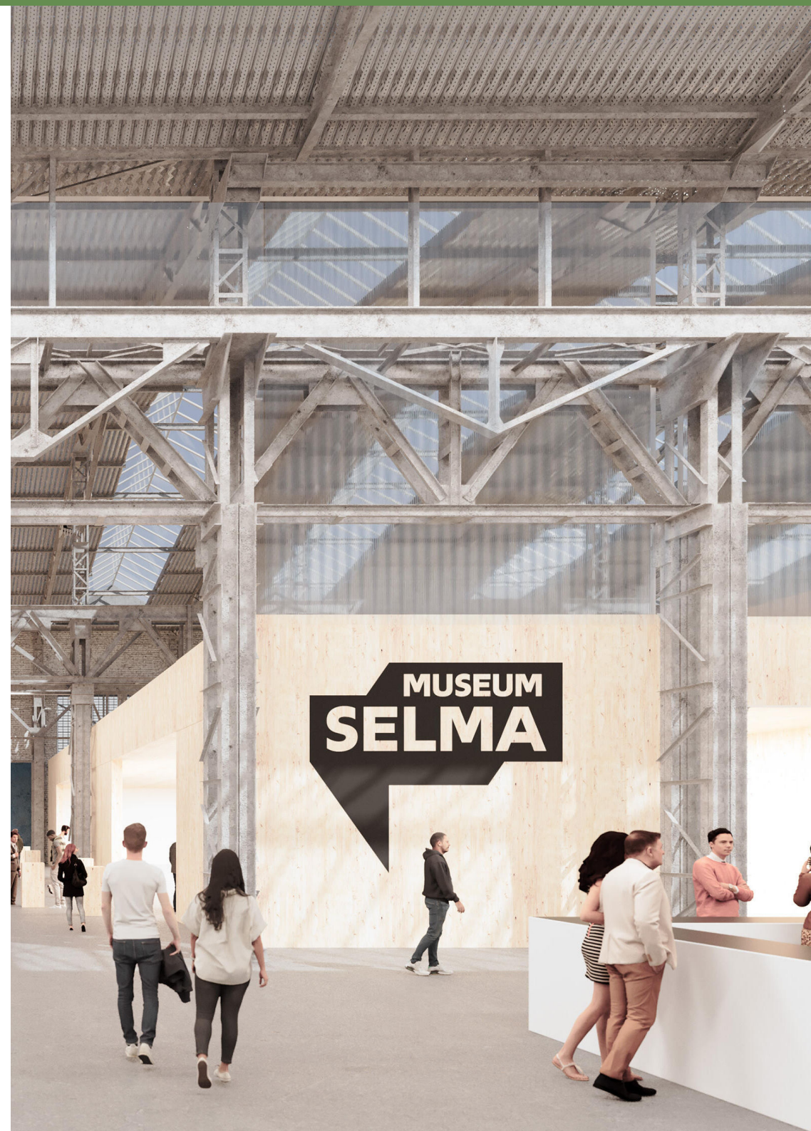
Abbildung: https://www.museum-selma.de/ / ATELIER BRÜCKNER

Am 9. Mai 2026 wird es einen Aktionstag der Initiative „Museum Selma bleibt“ geben.